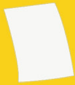
Ein Blatt Altpapier

Mit dieser Falle kannst du Fruchtfliegen lebend fangen. Zum Leeren nimmst du einfach Gummi und Papiertrichter ab und lässt die Fliegen draußen frei. Zum Nachbauen brauchst du diese Dinge: